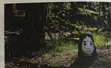
Klara Kristalova, "Ett eget liv", 2018.