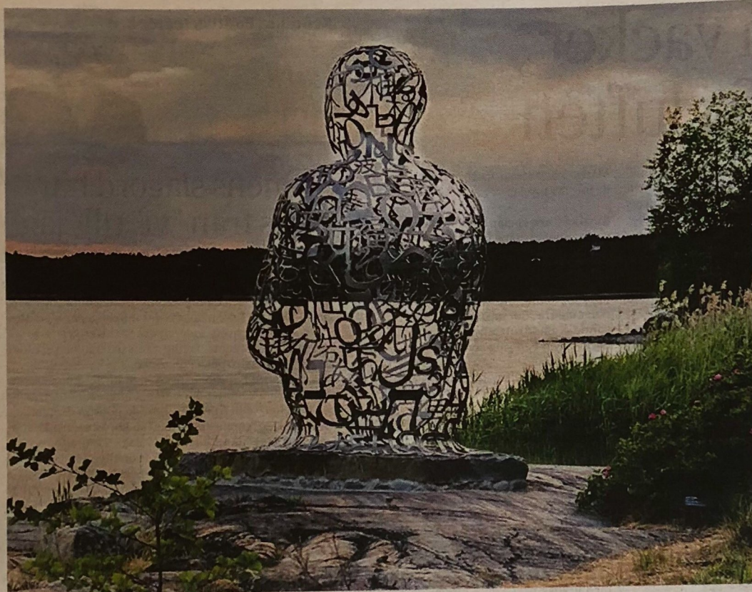
Jaime Plensa, "Ainsa IV", 2012.