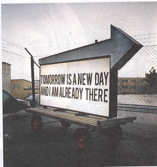
Ljusskulptur av Ulrika Sparre.

Ulrika Sparre, Beckers konstnärsstipendium, Färgfabriken. Lövholsbrinken 1, t o m 25 januari.