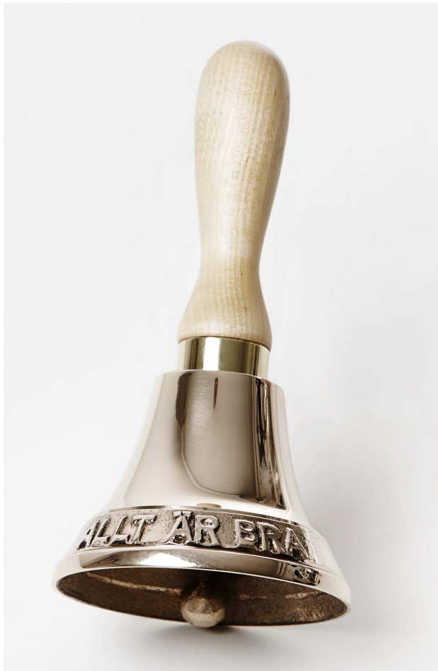
SAK Edition 3, 2015: Allt är bra av Ulrika Sparre. Tillsammans med klockan kommer en väst och pins. Se nästa sida.