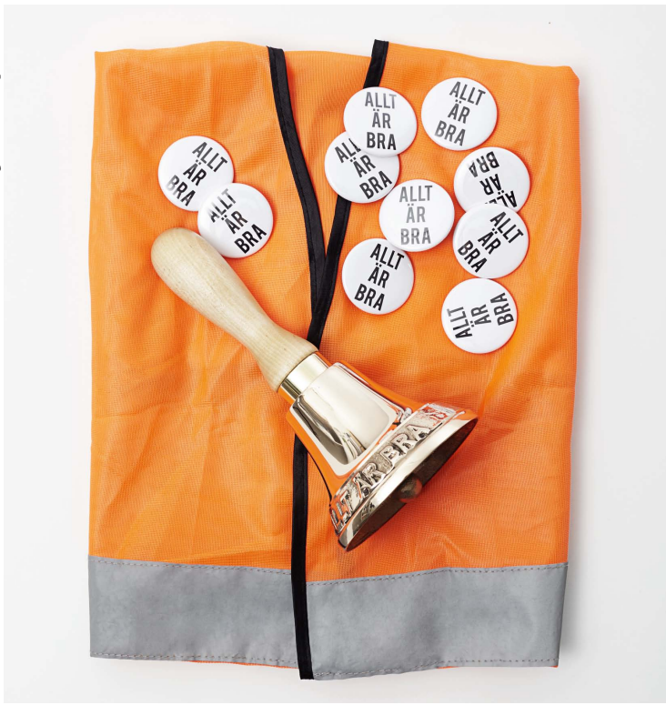
SAK Edition 3, 2015, Allt är bra , klocka, väst, pins.