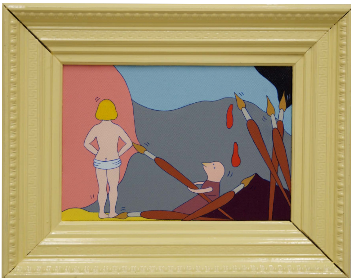
2015 års förstapris, vinst nr 1, är Fågelbarn och penslar av Marie-Louise Ekman. Olja på duk, 50 x 64 cm inklusive ram. Verket visades för första gången på årets vinstutställning på Konstakademien, Stockholm.