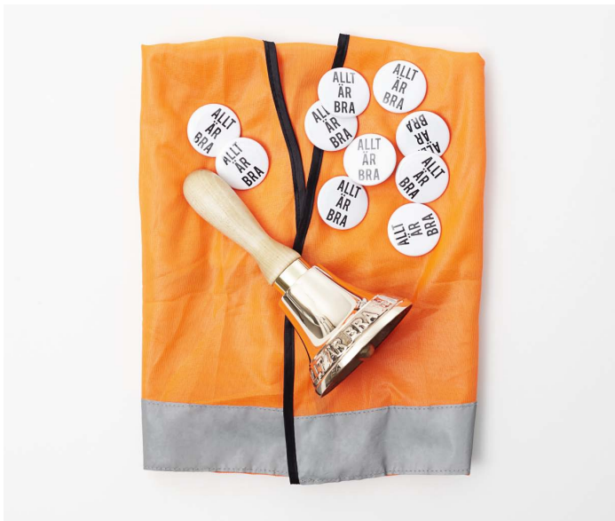
SAK Edition 3, 2015, Allt är bra , klocka, väst, pins.