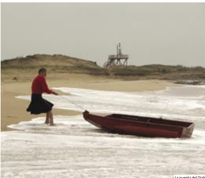
La puente del Diablo

W tym roku już po raz siódmy w ramach projektu Kino w budowie zaprezentowane zostaną najlepsze niezależne długometrażowe produkcje latynoamerykańskie. Kino w budowie powstało w 2002 roku dzięki współpracy Międzynarodowego Festiwalu Filmowego w San Sebastián-Donostia oraz Instytutu Cervantesa, by wspierać niezależ-